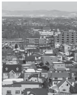
10月は土地月間です