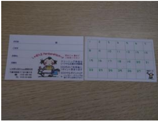
ハンガー・クリップ回収のポイントカード

クリーニング店では、衣類の折り目や型くずれ防止のため、ハンガーやスカート、ネクタイ用のクリップが使われます。しゃぼん玉では、このハンガーとクリップをポイント