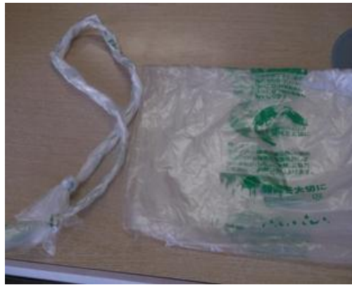
クリーニングカバーをひも状にしたもの

また、クリーニングした衣類をほこりから守るためのカバーをひも状にして、物を束ねる時などに利用することで、ごみの減量もできると紹介しています。