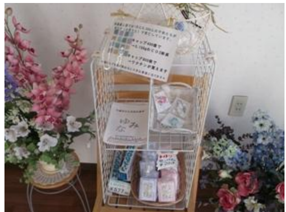
無添加石鹸とキャップ回収