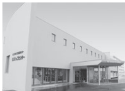
ちとせっこセンター

市は、地域コミュニティの充実を図り、地域的な連携意識を高めることを目的として、昭和47年に道内初の旧自治省のモデルコミュニティ地区に指定されて以来、市内11か所にコミュニティセンターを設置しています。