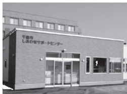
千歳市しあわせサポートセンター