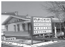
げんきっこセンター