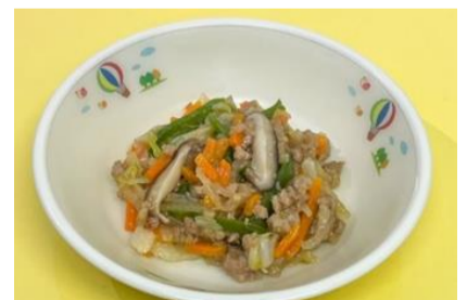
小学生 最優秀賞 千歳産食材のもりもり塩あんかけ風