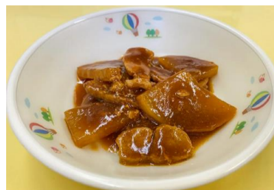
中学生 最優秀賞 大根とう米豚のデミグラス煮

昨年度、1月～2月の給食で最優秀賞に選ばれた「大根とう米豚のデミグラス煮」と「千歳産食材のもりもり塩あんかけ風」を提供し、子ども達から大変好評でした。これらのメニューが6月の給食に再び登場します。