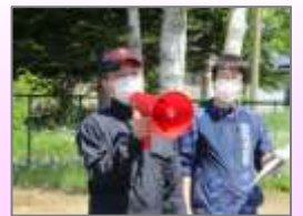
6月小中合同校外清掃

地域と密着し、子どもの未来のために、そしてやりがいのあるPTA活動ができるよう心がけています。