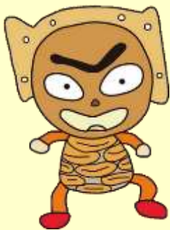
千歳市文化財キャラクター 「ママチくん」