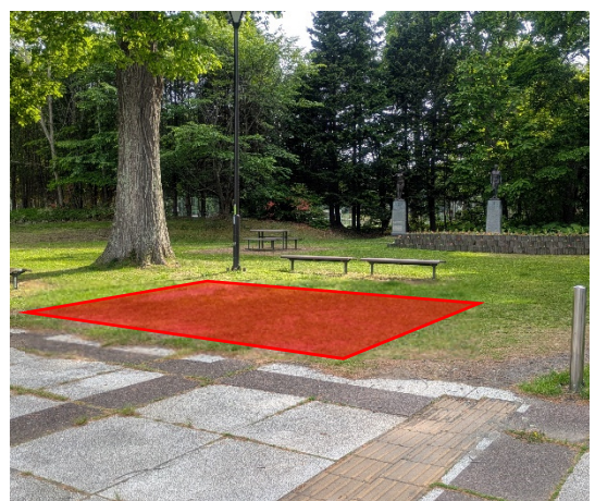
青葉公園(図書館付近)