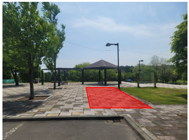
勇舞すこやか公園