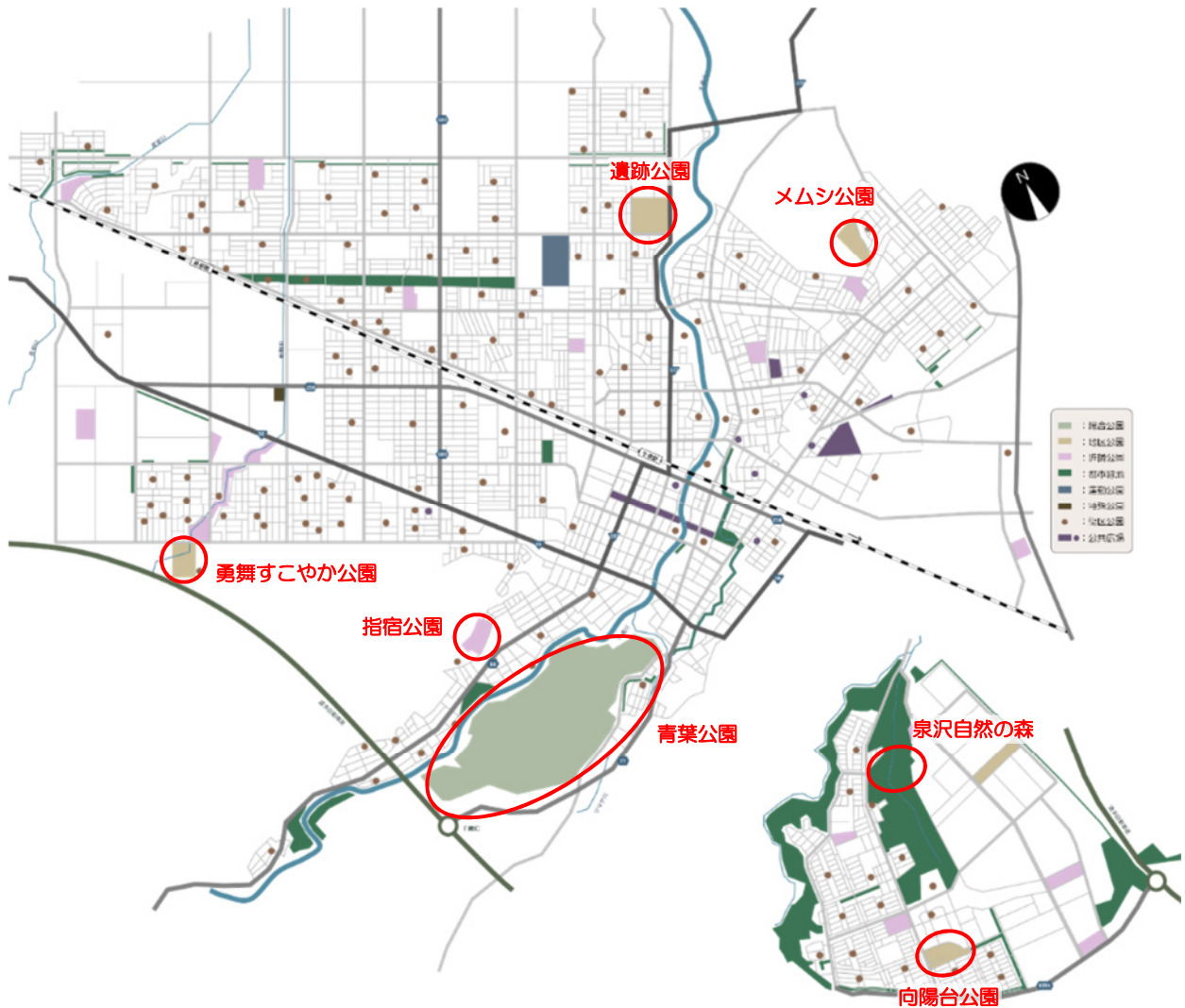
図 実施公園位置図