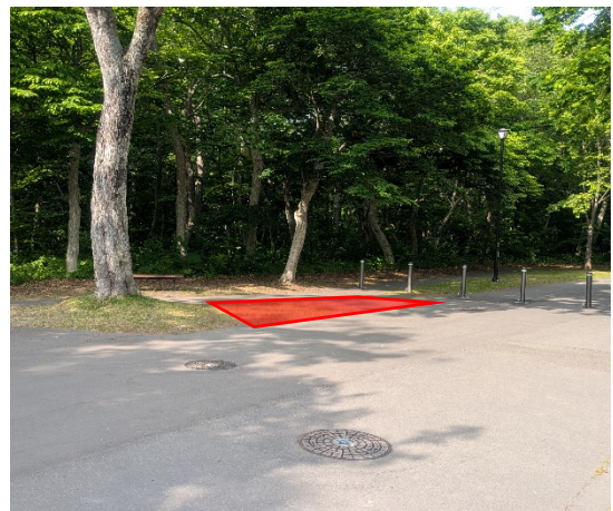
青葉公園(テニスコート付近)