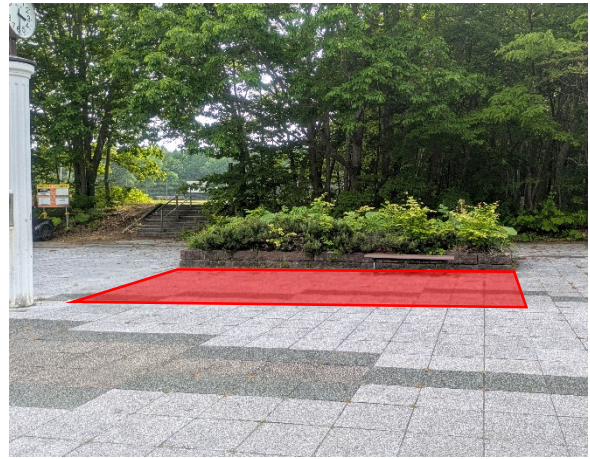
青葉公園（中央広場付近）