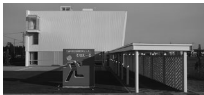
防災学習交流施設（そなえーる）