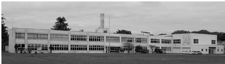
埋蔵文化財センター