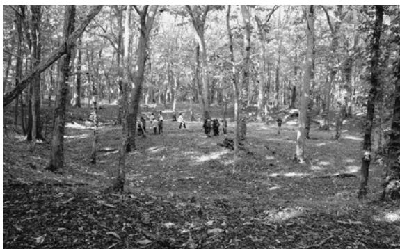
キウス周堤墓群 1号周堤墓