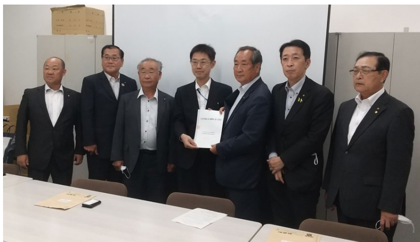
左から2人目が議長