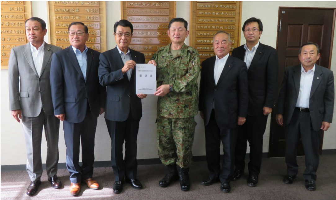
左から2人目が議長