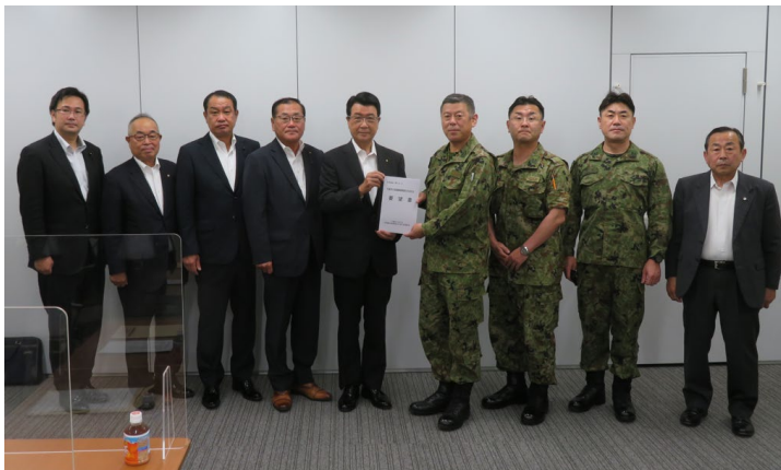
左から4人目が議長