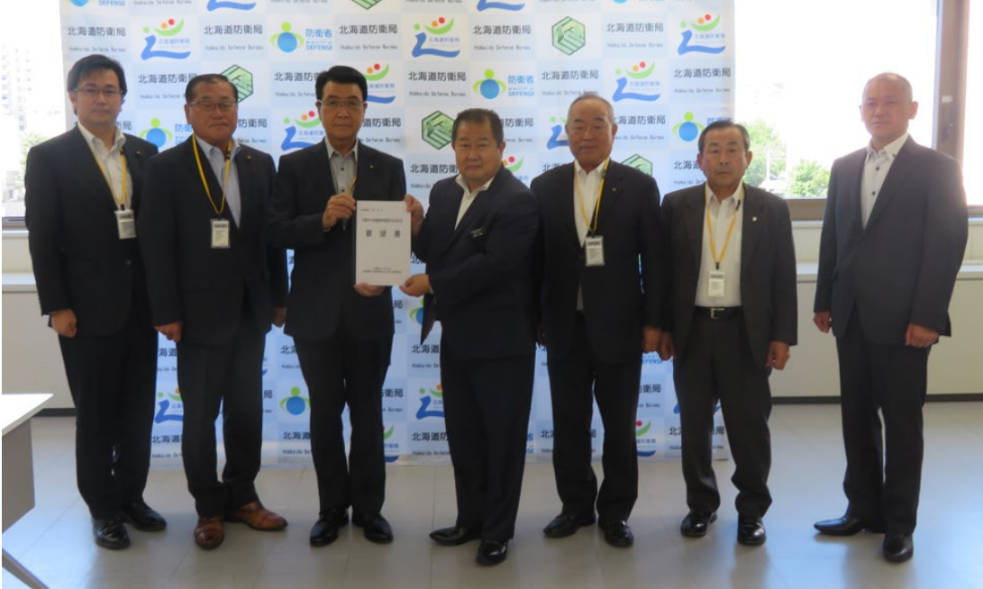
左から2人目が議長