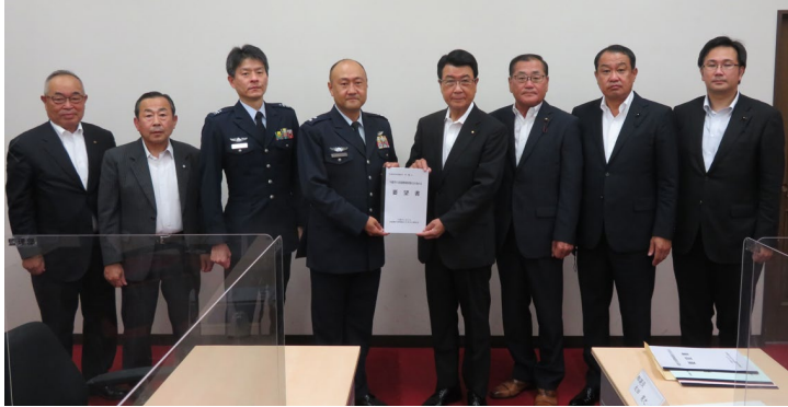
右から3人目が議長