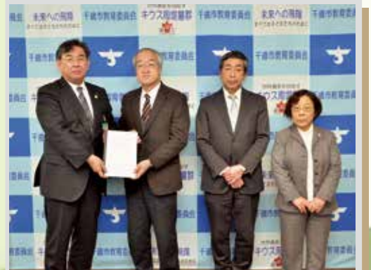
千歳市教育振興基本計画策定会議から教育委員会への計画原案報告の様子