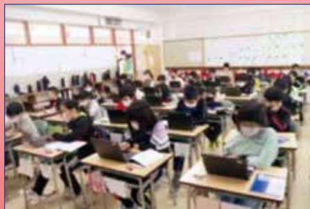
学習者用コンピュータを活用した授業の様子

今後も、学習者用コンピュータの充足や電子黒板等の更新を行うなど、子どもたちの学習環境を充実させるため、学校のICT環境の整備に努めます。