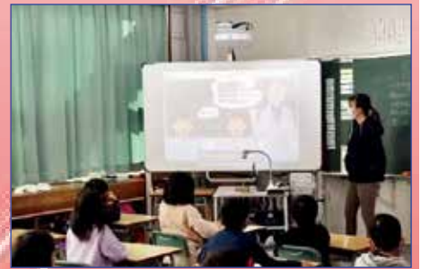
電子黒板を活用した授業の様子