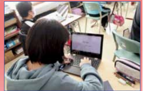
学習者用コンピュータ活用の様子