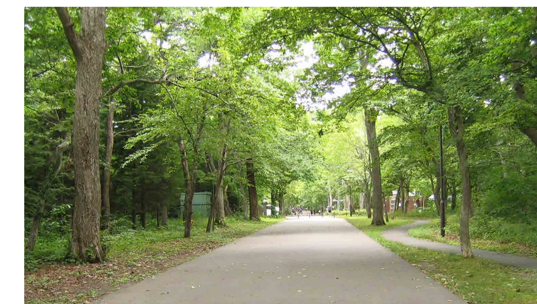
주 공원길 Main Mall

The whole family can have lots of fun with facilities including "Nakayoshi Hiroba (Square)" playground for small children, "Picnic Hiroba (Square)" space where camping is allowed, and "Chuo Hiroba (Square)" waterscape area with clear fountain water to play in, not to mention the well-equipped sports facilities such as a track & field stadium and a baseball ground.