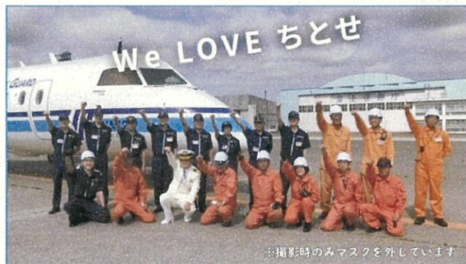
⑥ 最後に、「千歳が大好きです」と声を合わせて言ういただきました。