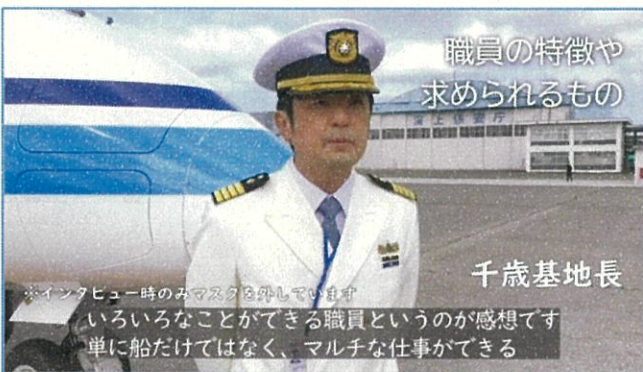
⑤ 職員の方々へインタビューを行いました。