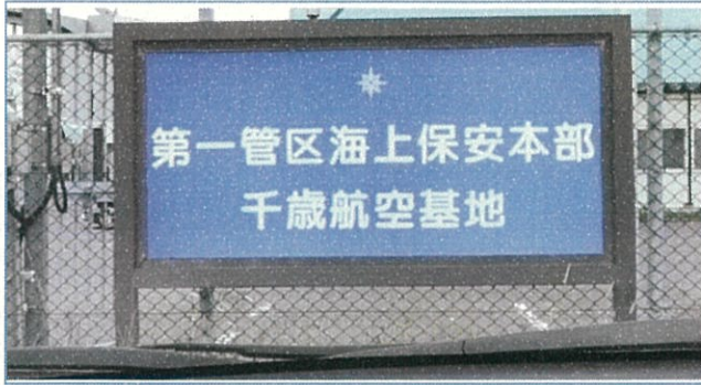
① 第一管区海上保安本部 千歳航空基地を訪問しました。

「We Love Chitose <<団体編>>」第1弾として、第一管区海上保安本部 千歳航空基地に訪問しました。