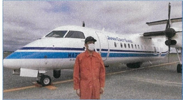
② 哨戒業務に同行させていただきました。