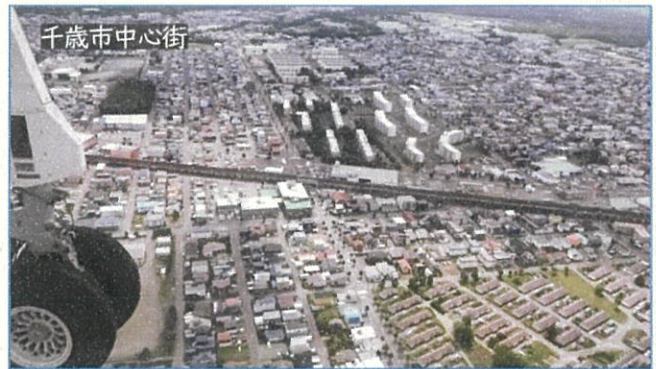
④ 緊張感あふれる哨戒業務ですが、普段は見ることができない空からの眺めは素晴らしかったです。