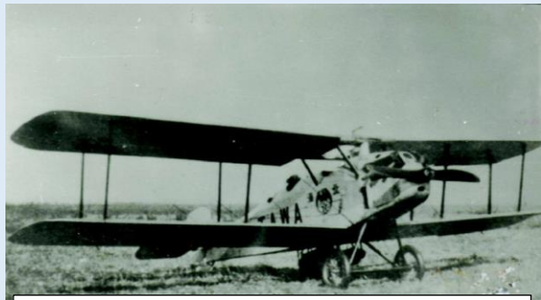
千歳にはじめて飛来した飛行機 「北海」第1号