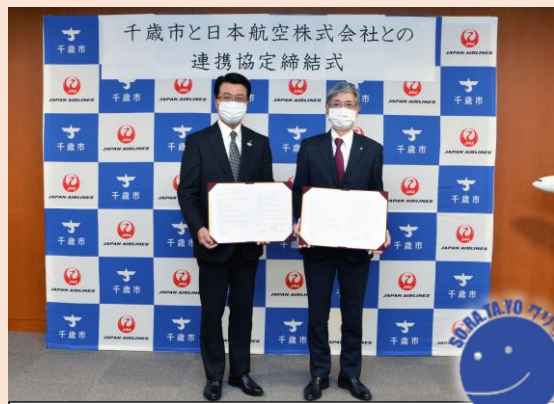
市は10月18日、日本航空株式会社と連携協定を締結しました。

空港開港95年を迎える本年は、民間航空再開から70年の節目の年でもあります。10月26日(火)に、抽選で選ばれた市民の方を招待し、千歳市・日本航空株式会社千歳空港支店・株式会社北海道エアシステムの共催による遊覧飛行を行います。