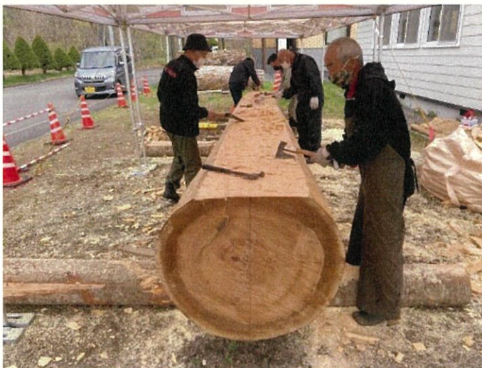
令和3年5月13日 船底削り