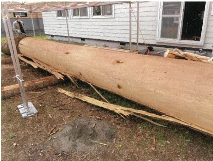
令和3年5月10日 樹皮剥ぎ