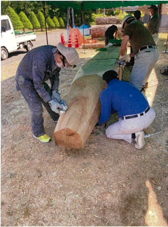
令和3年6月17日 船首削り