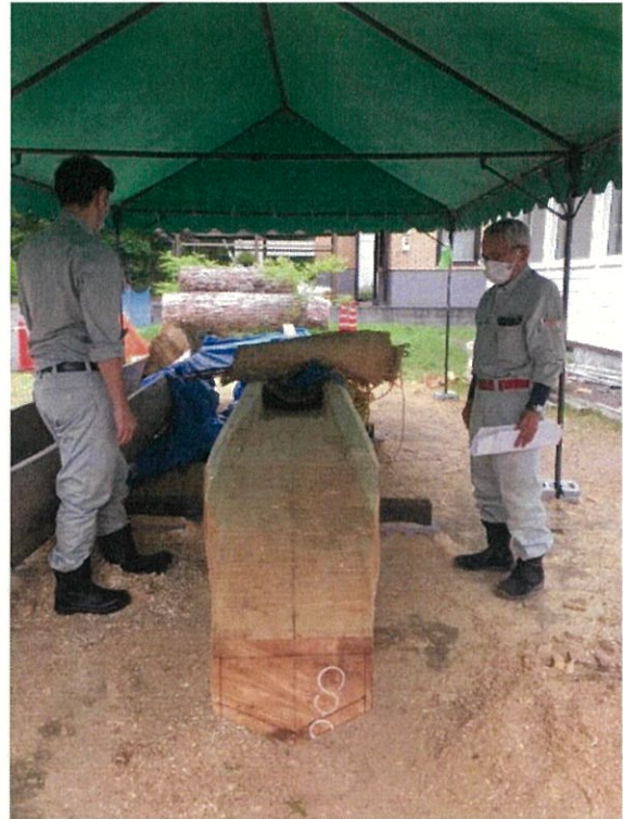
令和3年7月2日 船体内部削り(序盤)