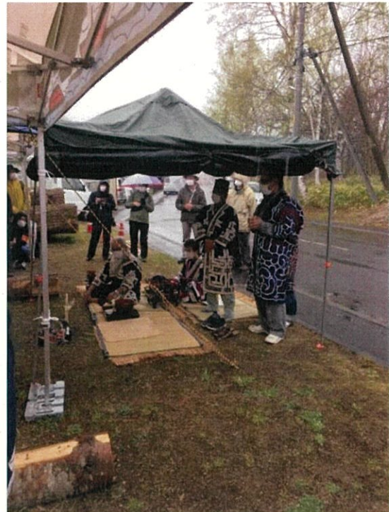
令和3年5月9日作業の安全を祈る『カムイノミ』を開催