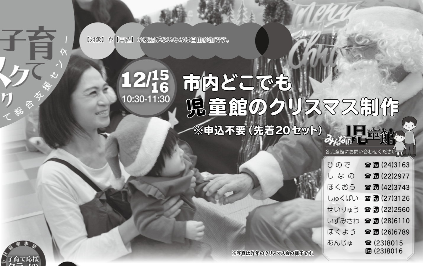
※写真は昨年のクリスマス会の様子です。