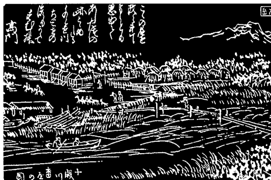
江戸時代末の千歳橋付近