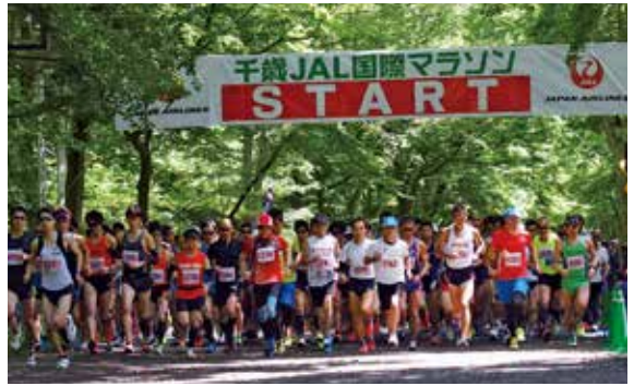
千歳 JAL 国際マラソン