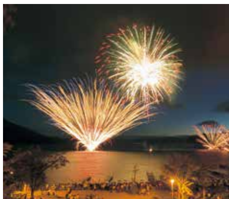
支笏湖湖水まつりの花火