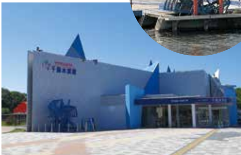
捕魚車「インディアン水車」 とサケのふるさと千歳水族館