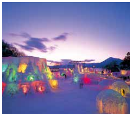
支笏湖水濤まつり