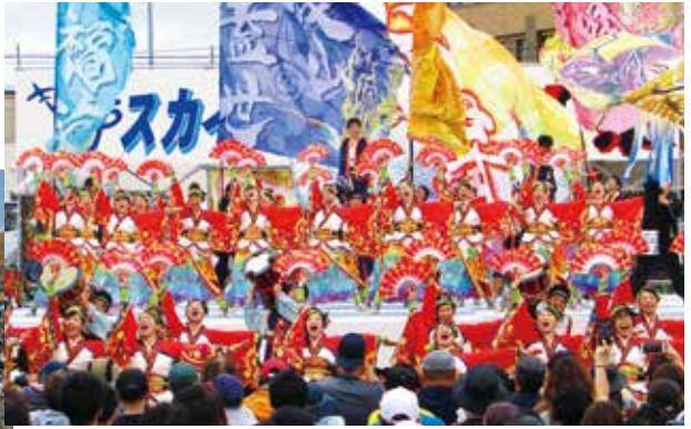
スカイ・ビア & YOSAKOI 祭