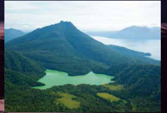
オコタンベ湖 Lake Okotanpe / Okotanpe湖 / 오코탄페호 / ทะเลสาบโอโคตันเปะ

※平成12年・17年・22年、27年は国勢調査(10月1日)の数値 ※令和元年10月1日現在