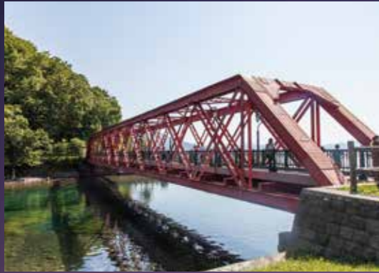
山線鉄橋 支笏湖湖畔園地 2018年土木学会選奨土木遺産に認定されています。 Yamasen Railroad Bridge Lake Shikotsu lakeside garden (Designated as a Recommended Civil Engineering Heritage by the Japan Society of Civil Engineers in 2018.) 山線鉄橋 支笏湖湖畔園地(于2018年入选土木学会选奨土木遺産。) 아마선 철교 시코쓰호 호반 원지(2018년 토목학회 추천 토목유산으로 인정되었습니다.) สะพานเหล็กยามาเซน (ถูกจัดให้เป็นมรดกทางวิศวกรรมโดยสมาคมวิศวกรรมญี่ปุ่น ในปี 2561)

支笏湖は、支笏洞爺国立公園に属するカルデラ湖で、国内では、秋田県の田沢湖に次いで2番目の深度を誇り、環境省の湖沼水質ランキングでは、平成19年から29年まで11年連続(通算19回)の全国1位に輝いています。 周囲には、樽前山や恵庭岳、風不死岳などの山々が連なるとともに、オコタンベ湖など豊かな自然が残されています。 支笏湖から流れ出て、市街地の中央を流れ、下流部において石狩川と合流する千歳川は、毎年サケが遡上する清流です。 また、千歳川の支流の一つである内別川は、千歳市民の飲み水を支える水源であり、その源頭部であるナイベツ川湧水は名水百選に選ばれています。