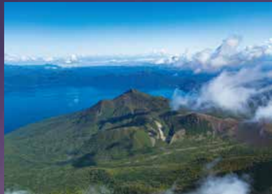
風不死岳 Mt. Fuppushi-dake / 风不死岳 풍부시산 / ภูเขาฟูฟุบุชิ