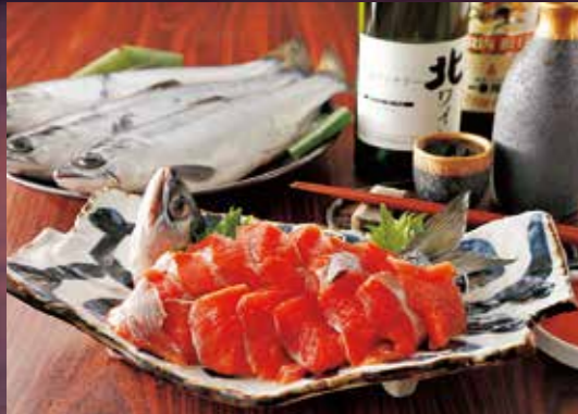
支笏湖チップ(ヒメマス) Lake Shikotsu Chip (red salmon) / 支笏湖红鲑鱼 (大马哈鱼) 시코쓰호 칩 (홍연어) / ปลาแซลมอนชีออกาย ทะเลสาบชิโคสึ (ฮิเมะมาส)