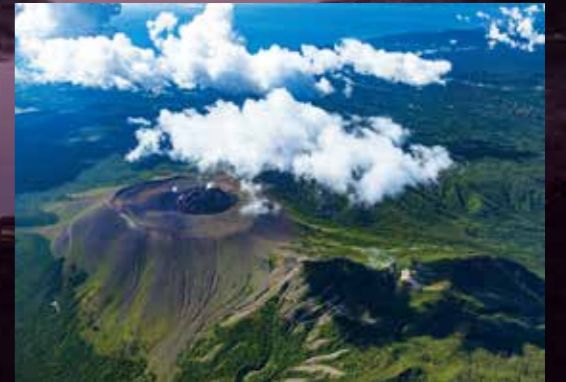
樽前山 Mt. Tarumae / 樽前山 / 다루마에산 / ภูเขาตารูมาเอะ