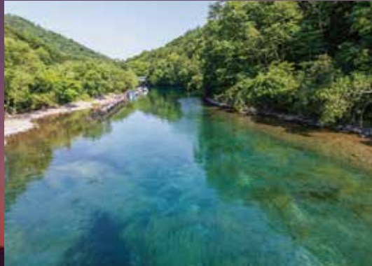
千歳川 Chitose River / 千岁川 차토세강 / แม่น้ำชีโตเซ