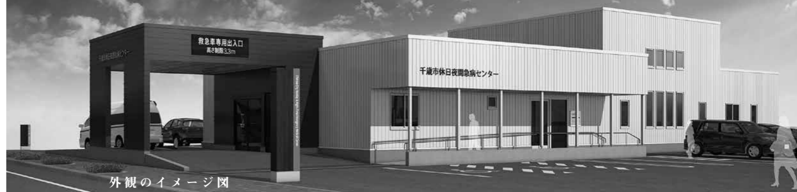
外観のイメージ図

今月の焦点は「休日夜間急病センター」の概要や施設の特徴、受診の際の留意事項などをお知らせします。