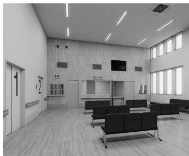
室内のイメージ図