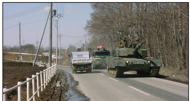
< 拡幅工事前の通行状態 >