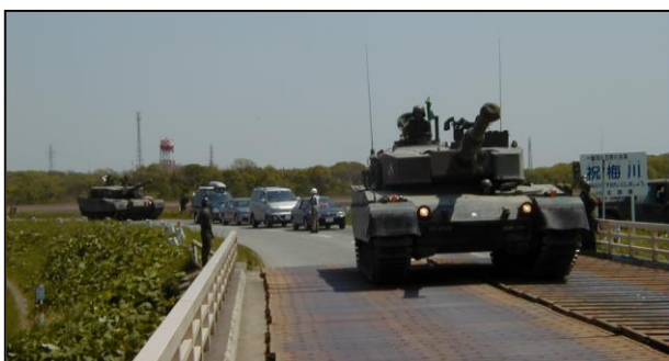
< 架け替え前の第2祝梅橋を通行する戦車 >