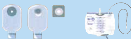
ストーマ袋（一体型、分離型） 導尿バック