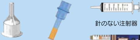
ペン型自己注射針 自己穿刺針 ペン型自己注射カートリッジ