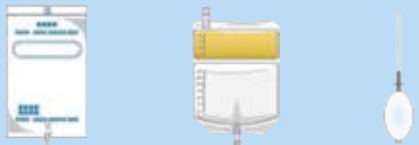
CAPD バック 栄養剤バック 洗腸