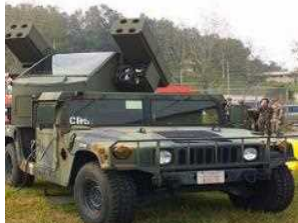
米陸軍：アベンジャー等 （非実射）