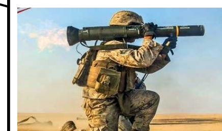
米陸軍：AT-4対戦車無反動砲等