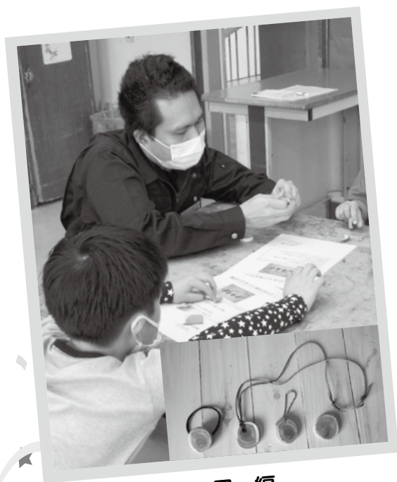
● 市民編 ～ 輪切りの木で小物をつくろう～

ご好評をいただいている『千歳学出前講座』の講座がさらに充実しました。 皆様の生涯学習活動、人との交流や情報収集の場としてご活用ください。