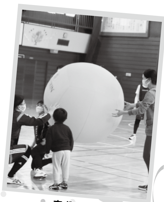
● 市役所編 ～ キンボール～