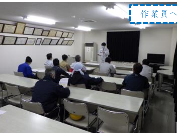
作業員への安全教育