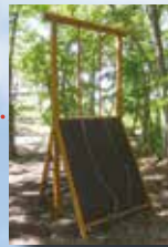
●リトルロッククライミング